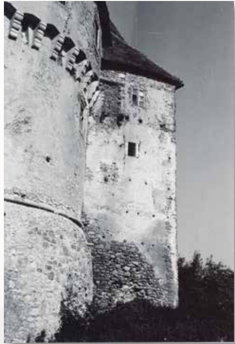
Veliki Tabor, sjeverna prigradnja (kat. br. 41) Veliki Tabor, northern extension (cat. no. 41)