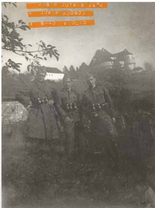
Partizani u podnožju Velikog Tabora 1943. godine (kat. br. 15)

Partisans at the foot of the hill at Veliki Tabor in 1943 (cat. no. 15)