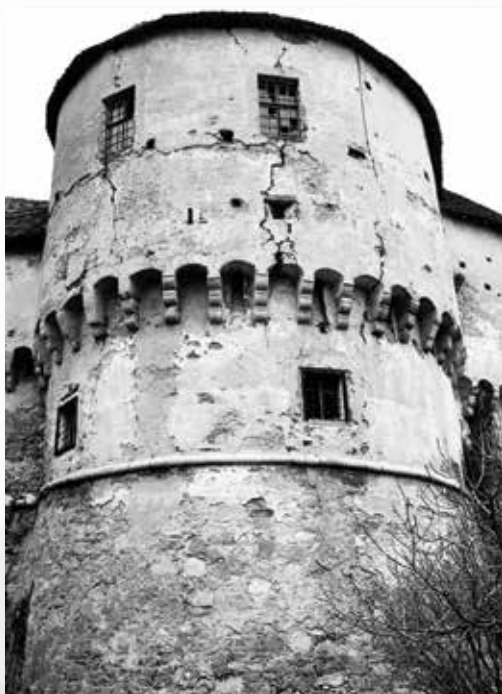
Veliki Tabor, južna kula (kat. br. 34)

Pentagonal bastion of Veliki Tabor complex, view from the east following roof repair and mending of wall around gate; photo by Š. Habunek, 1954; MK – UZKB – F; inv. no. 15616