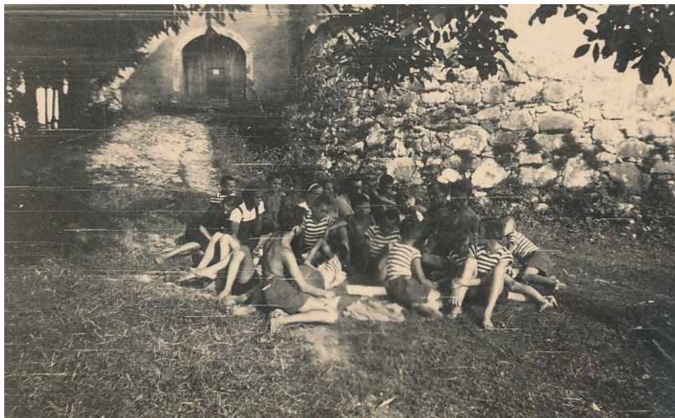
Dječja sekcija Društva prijatelja prirode ispred Velikog Tabora (kat. br. 13)

Children's Section of the Nature Lovers Society, in front of Veliki Tabor (cat. no. 13)