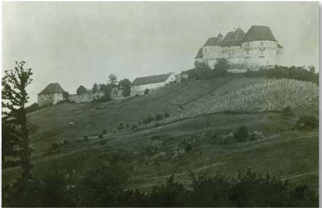
Veliki Tabor, pogled s južne strane; snimljeno 1911. god.; MK – UZKB – F; inv. br. 5418

Veliki Tabor, view from the south; photo taken in 1911; MK – UZKB – F; inv. no. 5418