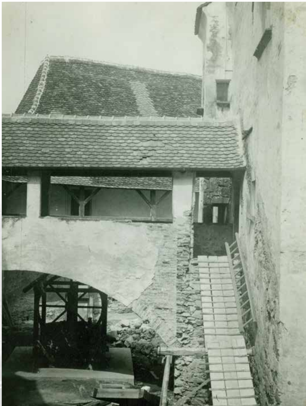
Veliki Tabor, oštećenje stubišta u dvorištu grada; 1941. god.; MK – UZKB – F; inv. br. 5472

Veliki Tabor, damaged stairwell in courtyard; 1941; MK – UZKB – F; inv. no. 5472