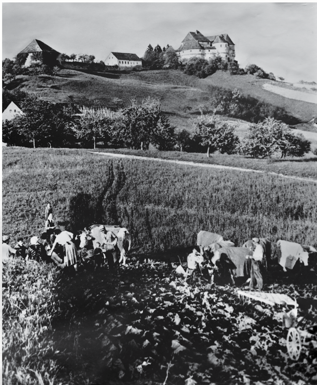
Seljaci na njivi podno Velikog Tabora (kat. br. 1)

Farmers on a field below Veliki Tabor (cat. no. 1)