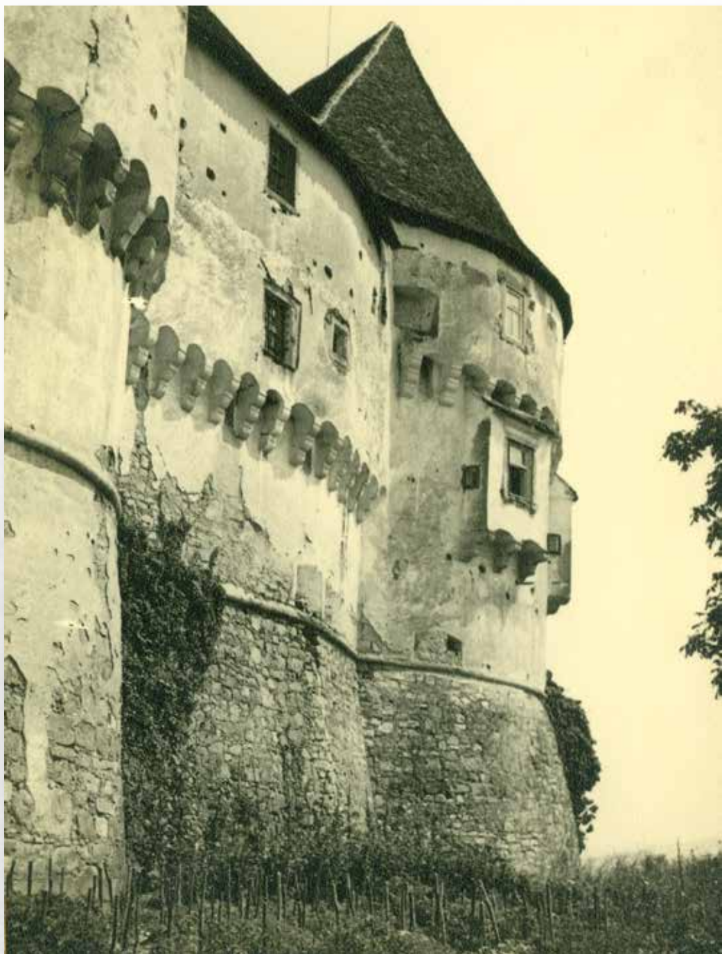
Veliki Tabor, istočna kula s konzolama i erkerima; snimio Vladimir Guteša, oko 1930. god.; MK – UZKB – F; inv. br. 9363

Veliki Tabor, east tower with consoles and bay windows; photo by Vladimir Guteša, ca 1930; MK – UZKB – F; inv. no. 9363