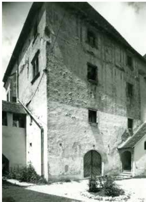
Veliki Tabor, peterokutna kula (palas), pogled na južno i istočno pročelje; snimio Nino Vranić, 1969. god.; MK – UZKB – F; inv. br. 29624

Veliki Tabor, pentagonal tower (great hall), view of south and east fronts; photo by Nino Vranić, 1969; MK – UZKB – F; inv. no. 29624