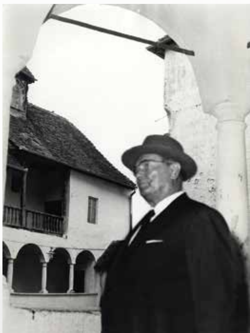
Josip Broz Tito u Velikom Taboru (kat. br. 20)

Jedno od važnijih kulturnih događanja u Velikom Taboru u tom razdoblju bilo je otvorenje izložbe »Ratkaji Velikotaborski u hrvatskoj povijesti i kulturi: 1502–1793« 1993. godine. Organizatori izložbe bili su Društvo Veliki Tabor iz Desinića i Hrvatski povijesni muzej iz Zagreba. Štimac je, kao predsjednik Društva osnovanog 1990. godine, bio jedan od urednika kataloga izložbe.