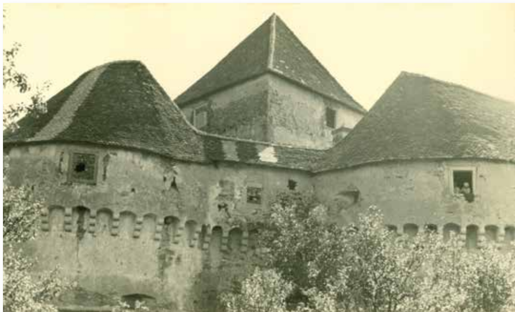
Veliki Tabor, gornji dio zapadne i jugozapadne polukružne kule s konzolama, 1940. god.; MK – UZKB – F; inv. br. 5432

Veliki Tabor, upper part of west and southwest semi-circular towers with consoles, 1940; MK – UZKB – F; inv. no. 5432