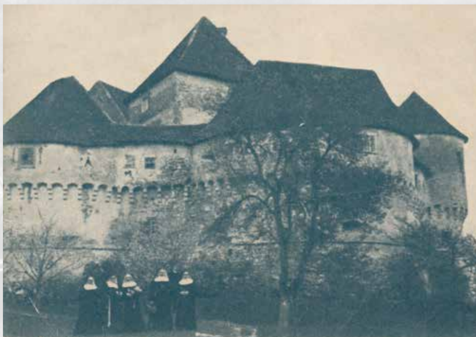
Razglednica »Vin-grad ili Tabor-grad« (kat. br. 5)

Children's Section of the Nature Lovers Society, in front of Veliki Tabor (cat. no. 13)