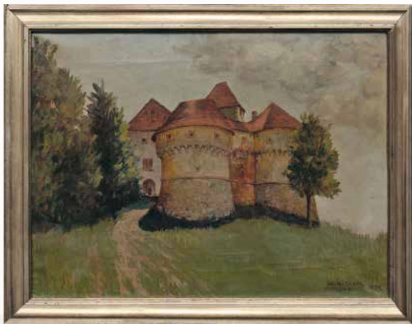
Oton Iveković, Veliki Tabor , 1925. (kat. br. 24)

Oton Iveković, Veliki Tabor, 1925 (cat. no. 24)