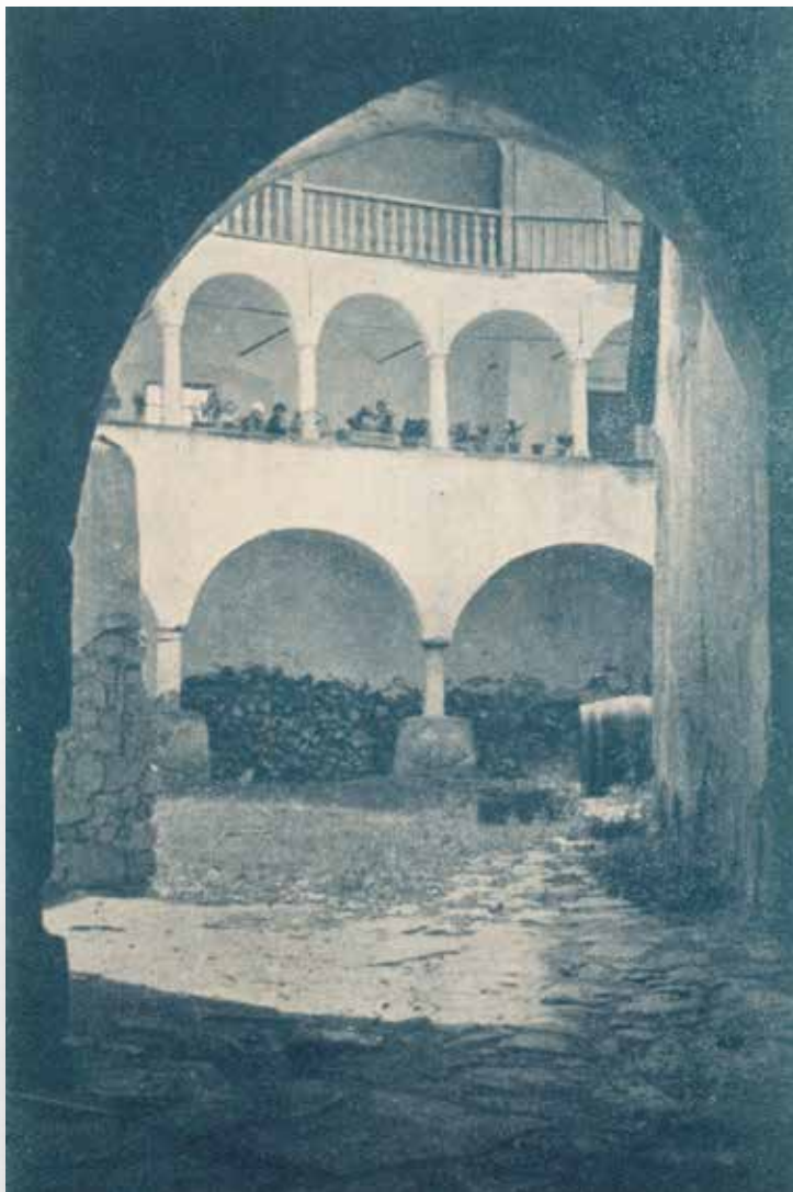
Razglednica »Vin-grad ili Tabor-grad (dvorište)« (kat. br. 7)

Postcard "Vin-grad or Tabor-grad (courtyard)" (cat. no. 7)