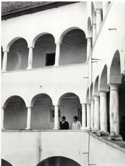
Josip Broz Tito sa suprugom Jovankom u Velikom Taboru (kat. br. 21)

Josip Broz Tito with his wife Jovanka at Veliki Tabor (cat. no. 21)