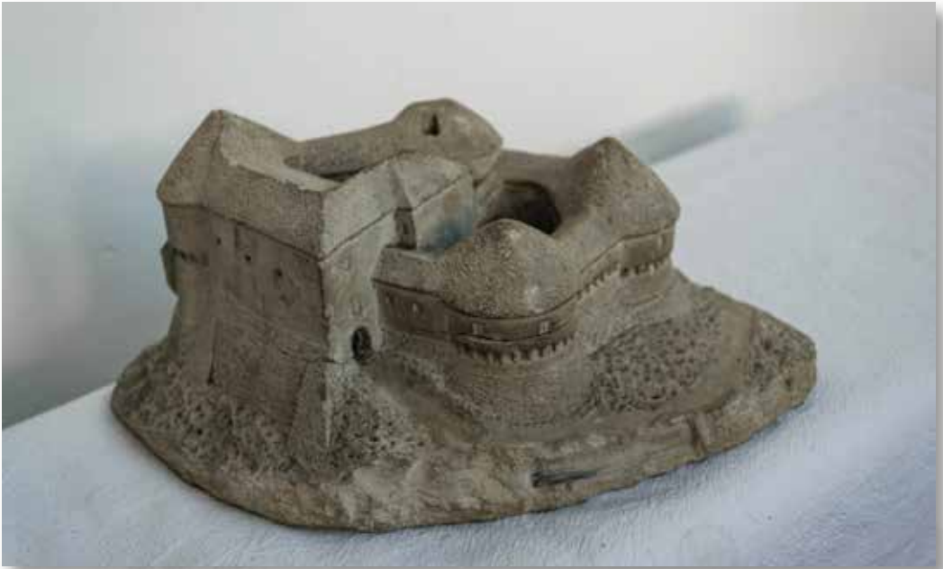
Maketa Velikog Tabora (kat. br. 16)

A maquette of Veliki Tabor (cat. no. 16)