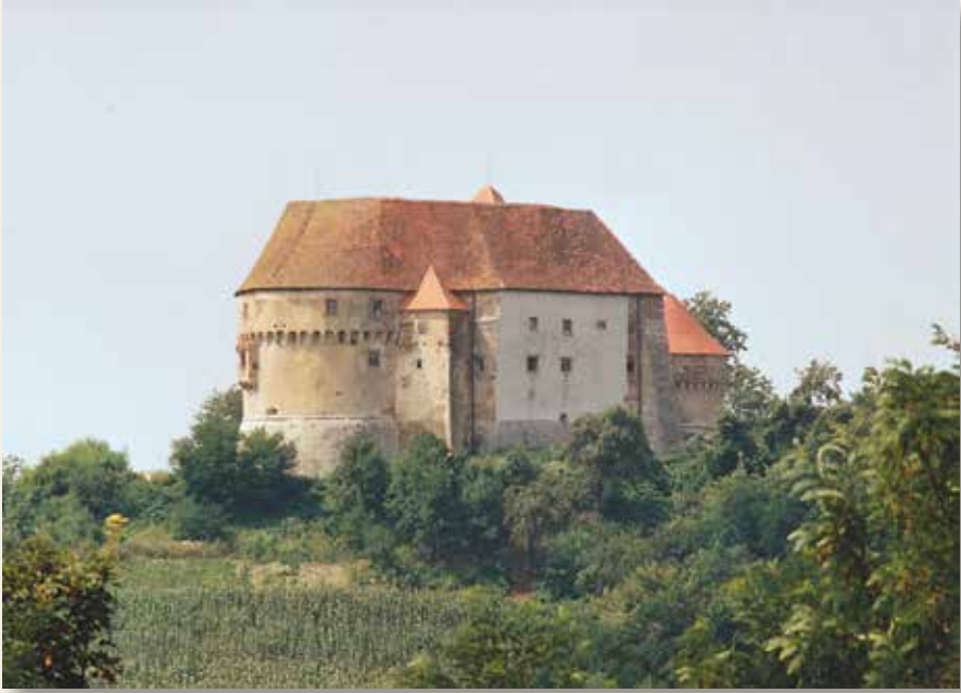
Veliki Tabor, pogled sa sjeverne strane (kat. br. 48)

Veliki Tabor, view from the north (cat. no. 48)