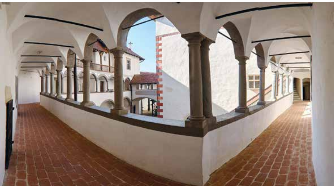
Dvorišne galerije Velikog Tabora

No bilo bi pogrešno tvrditi da je dvorac bio sasvim zaboravljen i zapušten. Početkom 1960-ih godina Konzervatorski zavod iz Zagreba izvršio je srazmjerno opsežne radove na najugroženijim dijelovima koji su obuhvatili popravak krovne konstrukcije i krovništva, sanaciju i zamjenu konzola, sanaciju jednog dijela sjevernog vanjskog pročelja itd. Održavana su razna događanja i zabave. Neko je vrijeme (u drugoj polovini 40-ih ili u 50-im godinama) u dvorcu bila otvorena izložba o Narodnooslobodilačkoj borbi na području kotara Pregrada, na kojoj su izloženi brojni dokumenti, biografije i fotografije poginulih partizana i njihovih suradnika. Godine 1975. u njemu su snimane scene napada kmetške vojske na Tahyjev grad za višestruko nagrađivani film Seljačka buna 1573. po-