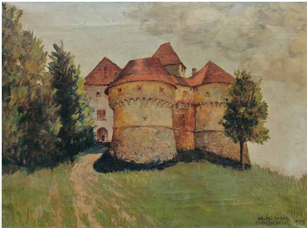
Oton Iveković, Veliki Tabor , 1925. g. Muzej seljačkih buna, MSB 136