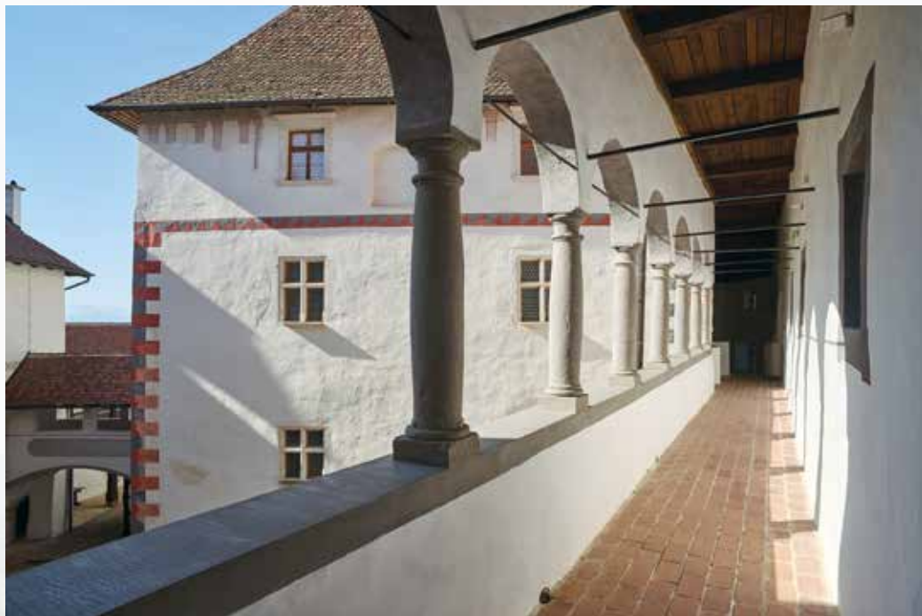
Pogled na dvorišnu galeriju i peterokutnu kulu (palas) Velikog Tabora

segla vrhunac ugleda i moći u 17. stoljeću, kada su živjeli njezini najugledniji pripadnici i kulturni stvaratelji: Nikola I., Juraj II., i Ivan III. Adam.