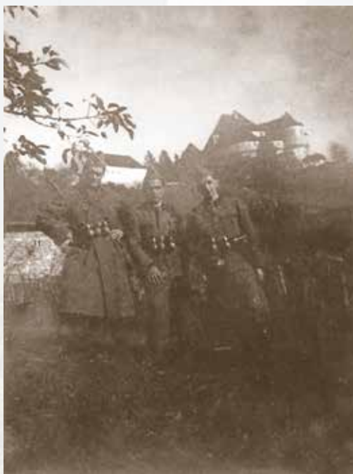
Partizani u podnožju Velikog Tabora, 1943. g., DVT Fot-16

U socijalističkoj Jugoslaviji grad je bio nacionaliziran i dodijeljen na upravljanje općini Pregrada. Ona mu nije osigurala odgovarajuću namjenu, nego ga je najprije predala na korištenje mesnoj industriji Sljeme , a potom Poljoprivrednoj zadruzi Desinić , koja je u njemu otvorila ugostiteljski objekt i organizirala svadbene svečanosti.