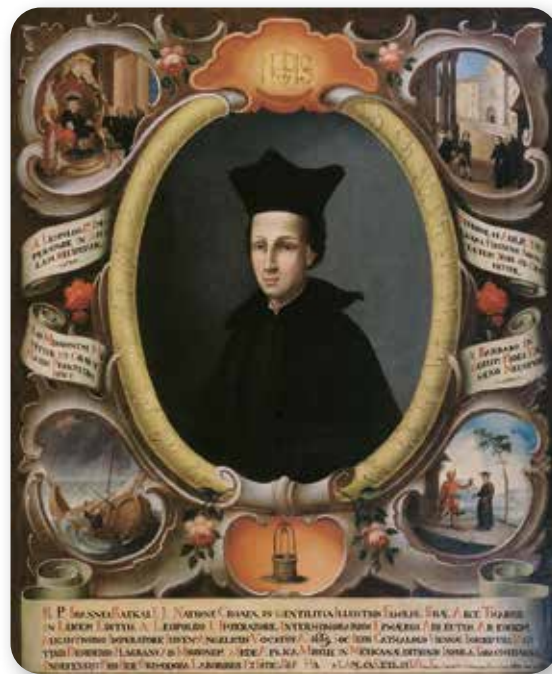
Portret Ivana Rattkaya, Hrvatski povijesni muzej, Zagreb, inv. br. HPM/PMH 2422

Ivan III. Adam rođen je 22. svibnja 1647. godine u Ptuj u Štajerskoj. Ostao je zapamćen kao iznimno nadaren student filozofije i teologije, poliglot te omiljeni paž na dvoru cara Leopolda I. Stupio je u isusovački red i, čim mu se pružila prva prilika, prijavio se za misionarsku službu u španjolskoj koloniji Meksiku. Dok je čekao na brodovlje za Ameriku, dvije je godine proveo u španjolskome gradu Sevilli. Zajedno s drugim misionarima posvetio se učenju i izučavanju mnogobrojnih zanata. Izrađivali su kompase, sunčane satove, stakleno i